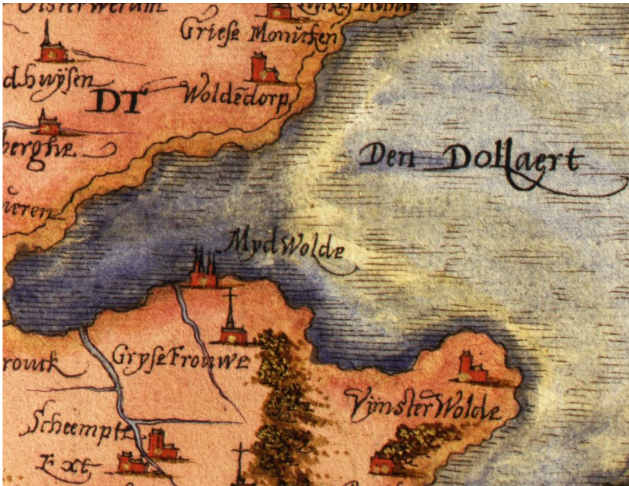
Christiaan Sgroten - Uitsnede van File:Sgroten - Groningen - kleur.png

Het Grijzevrouwenklooster werd in 1569 geplunderd door de watergeuzen, waarop de abt van Aduard voorstelde om de nonnen te verplaatsen naar het Klooster Yesse te Haren. Niet alle nonnen gingen daarheen, waarop tussen de vertrekkers en blijvers onenigheid ontstond over de verdeling van de inkomsten, met name die van het voorwerk te Lalleweer. Bij de Reductie van 1594 werd de kloostergoederen in beslag genomen en moesten de overgebleven zes nonnen (waaronder prioeres Frida Oomkens en proost Nicola Aspherdino) vertrekken.