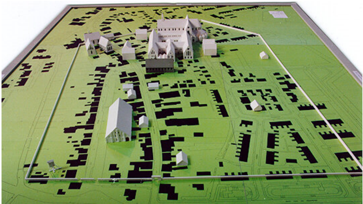
Plattegrond dorp Aduard met daarop de maquette van het klooster.

Vooral doordat er meerdere vooraanstaande personen in de kloosterschool van de abdij van Aduard verbleven, heeft het klooster bekendheid gekregen. Al vroeg had het klooster een buitenschool bij Bedum, Roodeschool genaamd, waar het huidige gehucht Rodeschool ligt. Deze gaf aan de destijds toekomstige monniken en conversen de gelegenheid om zich in de beginselen van de wetenschap te verdiepen. Daarnaast bezat het klooster een binnenschool waar de gevorderden onderwijs kregen in de vrije kunsten en het canonieke recht (artes et canones).